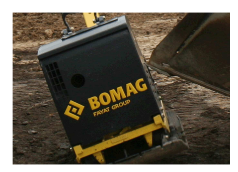
Maximale Langlebigkeit Vollschutzhaube - Motor und Komponenten rundum geschützt