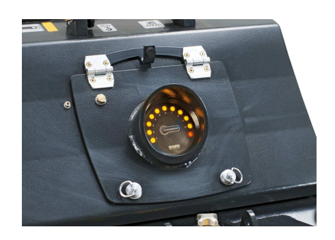
Mehr Qualität, weniger Kosten ECONOMIZER - Die Verdichtungsanzeige (optional)