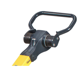
Präzise und sicher bedienbar Komfort-Hebel-Steuerung